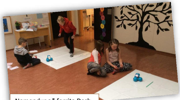
Nemendur að forrita Dash