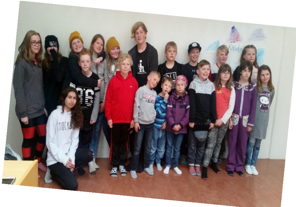
Nemendur í Hríseyjar- og Grímseyjarskóla